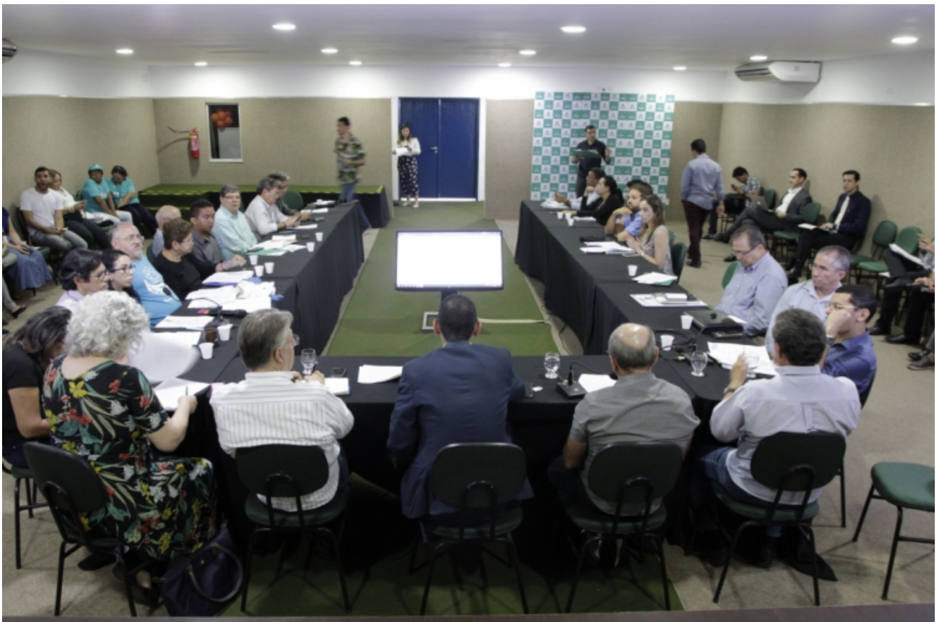
FORTALEZA, CE, Brasil. 02.12.2019: Reunião do Núcleo gestor sobre o plano gestor

O Núcleo Gestor de Revisão do Plano Diretor Participativo de Fortaleza, em sua primeira reunião ordinária realizada nesta segunda-feira, 2, definiu os nove primeiros artigos do Regimento Interno, responsável por comandar as ações de trabalho. Em uma semana, o restante dos 22 artigos do Regimento também serão definidos para que as discussões com a comunidade comecem. A previsão da Prefeitura é de que o texto final seja encaminhado à Câmara Municipal no começo do segundo semestre de 2020.